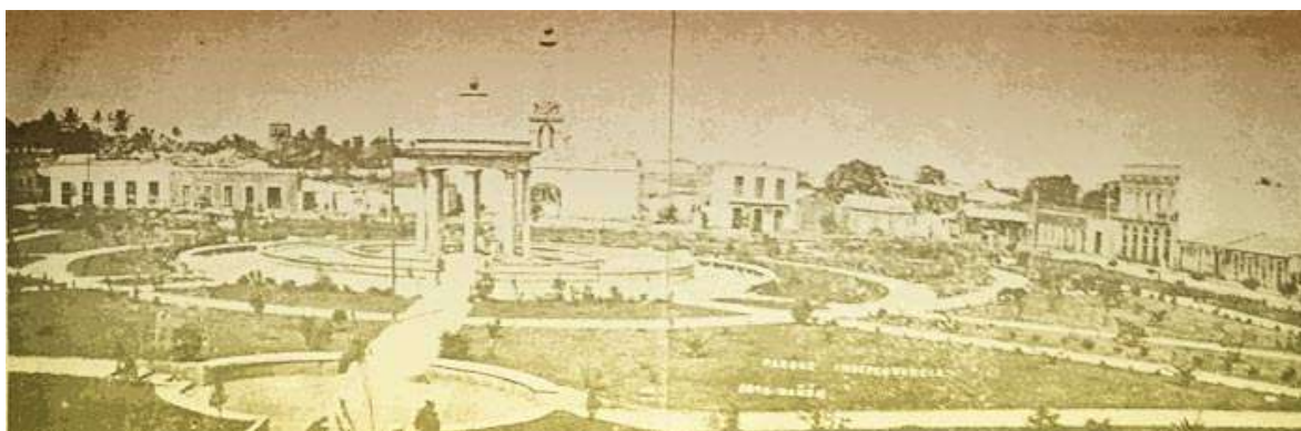
Vista panorámica de la "Plata Independencia" con el Baluarte al fonda y sobre éste, el monumento que el Ayuntamiento encargara al Ing. Osvaldo B. Báez para conmemorar el 50 Aniversario de la Restauración (16 de Agosto 1913).- "Blanco y Negro" Np. 255 del 19 de Octubre 1913. Este monumento y el de 1924 fueron demolidos después de varias semanas y la madera subastada.