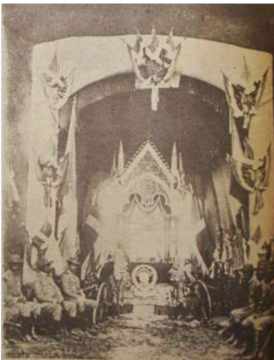
Capilla Ardiente levantada bajo la arcada del Baluarte "27 de Febrero", para velar los Restos del Héroe Nacional Antonio Duvergé (27 de Febrero 1911) "Blanco y Negro" No. 129 del 5 de Marzo 1911.